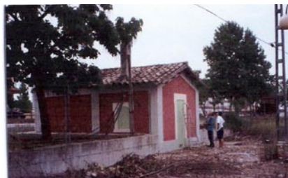
Foto 3 (izquierda): Día 26 de julio de 2006: José Aranda y Carlos Hijazo restaurando la madera del depósito.