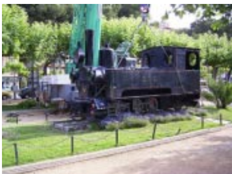
Texto y fotos: Ignasi Griñón

La locomotora Kraus 2355 número 1 en el ferrocarril de Sant Feliu de Guíxols, con su traslado a la empresa Condel de Santa Perpetua de la Moguda inicia el proceso de restauración del tren.