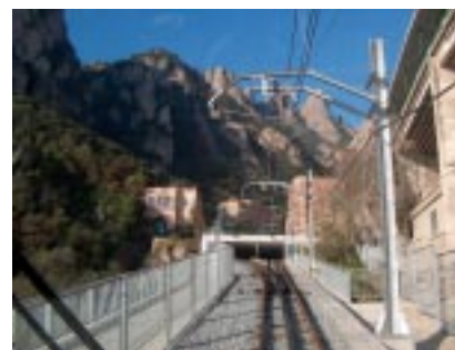
Fotografies: Eduard Biosca